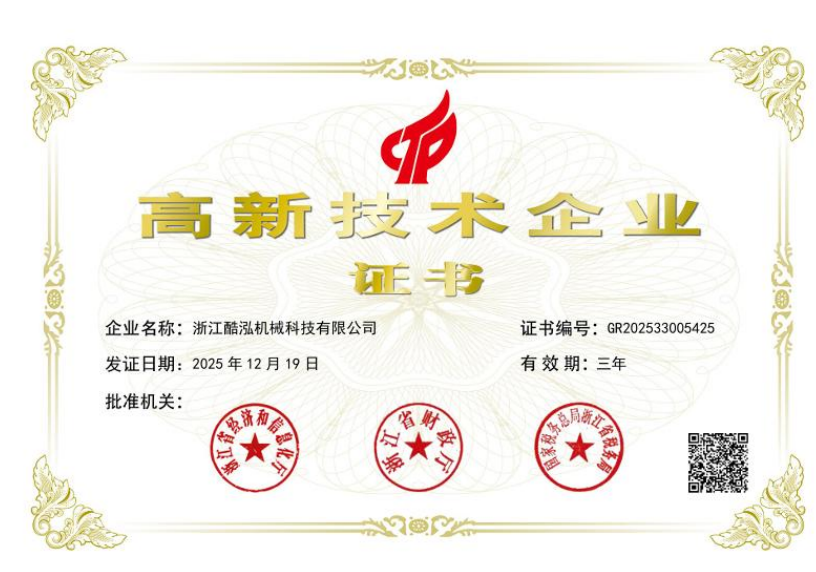
表3.3-2 公司诚信经营的成果

公司高层遵循“人无信不立，厂无信不存”的诚信共赢思想，从组织结构设计、工作流程优化、规章制度完善等方面为公司守法诚信经营创造了一个良好的环境，并在日常工作中带头践行。公司被授予高新技术企业、浙江出口名牌、浙江省中小企业，如图 3.3-1 所示：